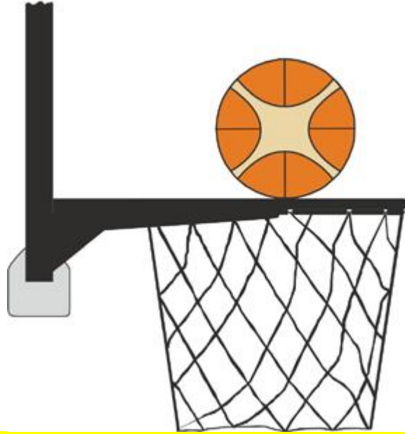
الشكل (٢) الكرة على اتصال بالحلقة Diagram 2 Ball in contact with the ring

٣١-١١ البيان: تحدث العرقلة من قبل لاعب مدافع أو مهاجم أثناء تصويبه لإصابة ميدانية عندما يلمس لاعب السلة أو اللوحة بينما تكون الكرة على تماس مع الحلقة ولا تزال الإمكانية قائمة لدخولها في السلة .