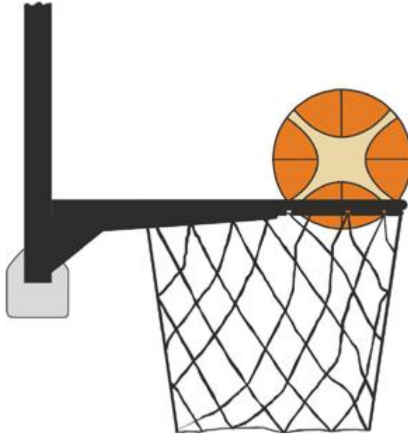
الشكل (3) الكرة داخل السلة Diagram 3 Ball is within the basket

١٨-٣١ مثال : حاول A1 تسديد تصويبة ميدانية . بينما الكرة تدور حول الحلقة وينزلق جزء منها داخل أو اسفل مستوى الحلقة لمس B1 الكرة .